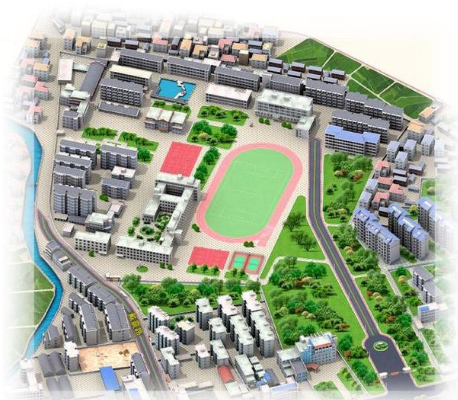
黄山学院横江校区平面图